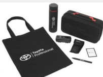
Zestaw prezentowy Professional Gadżety