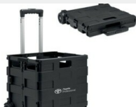
Skrzynka bagażowa Gadżety

Toyota PROACE CITY VERSO 1.2 Benzyna YARERHNP2GJ085168