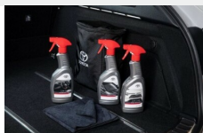
Zestaw kosmetyków samochodowych Toyota Kosmetyki